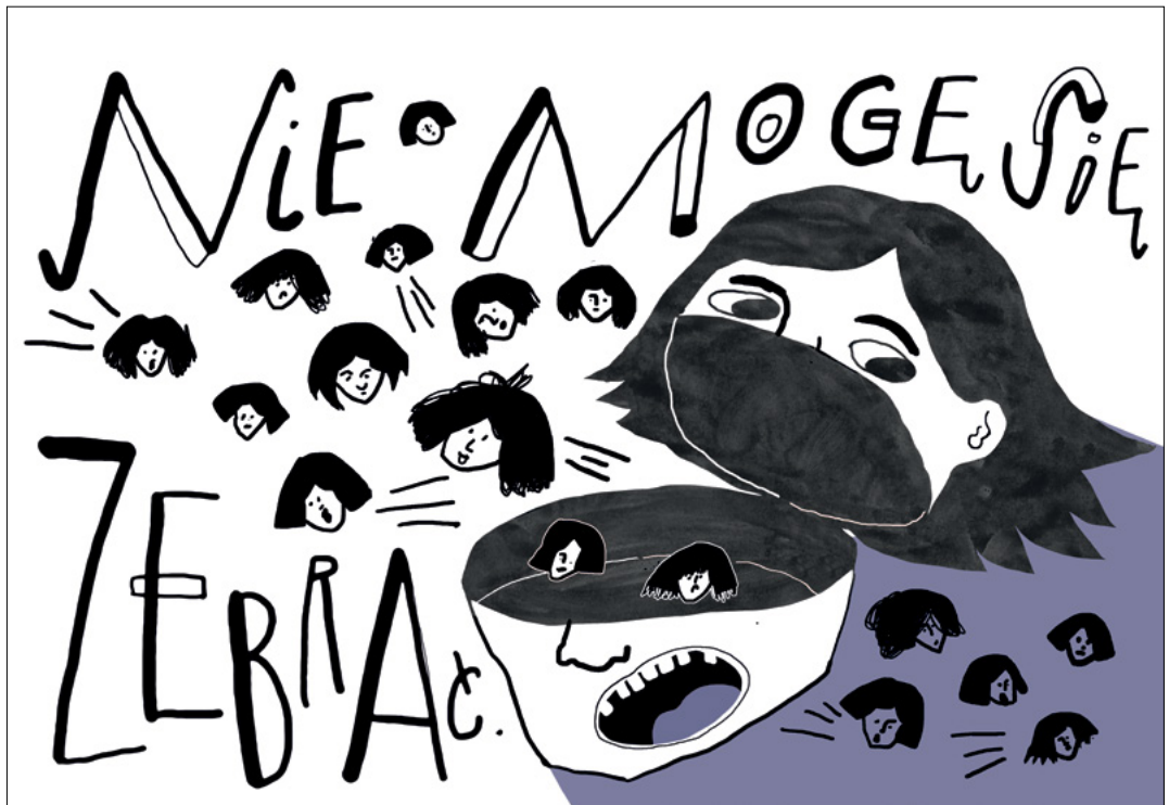
przykłady ilustracji do książki „Te wszystkie straszne nie”