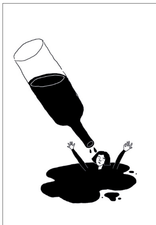
próby ilustracji do książki „Te wszystkie straszne nie”