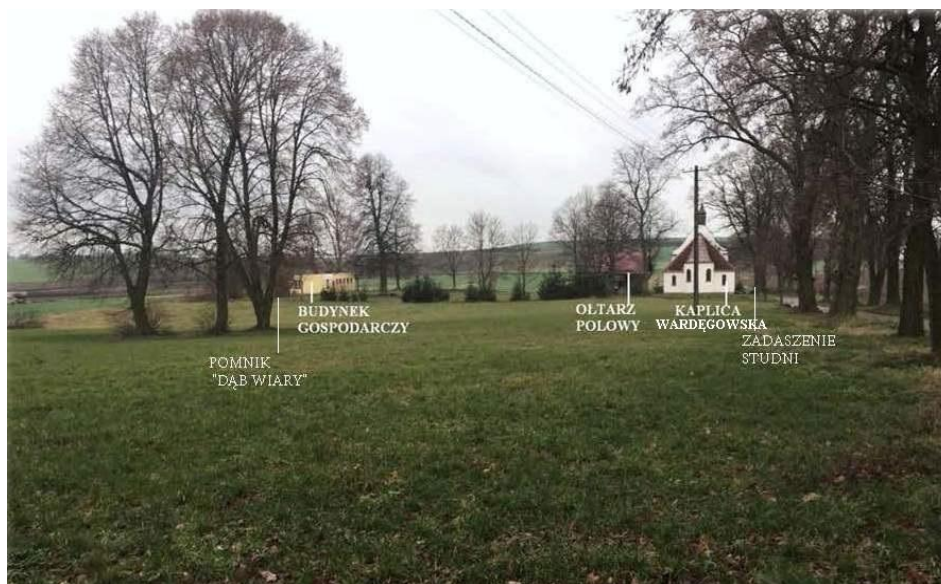
Fotografia 1. Teren sanktuarium objęty opracowaniem projektowym, istniejące obiekty

W ramach założeń projektowych planuje się rozebranie ołtarza polowego, drewnianego zadaszenia studni i budynku gospodarczego. Projekt zakłada stworzenie obiektów wokół istniejącej XX-wiecznej kapliczki, jak również opracowanie funkcji stref i komunikacji między nimi. Całość stworzona będzie w oparciu o zatwierdzony przez kustosza kalendarz liturgiczny związany z odbywającymi się tu cyklicznie od wiosny do jesieni uroczystościami: