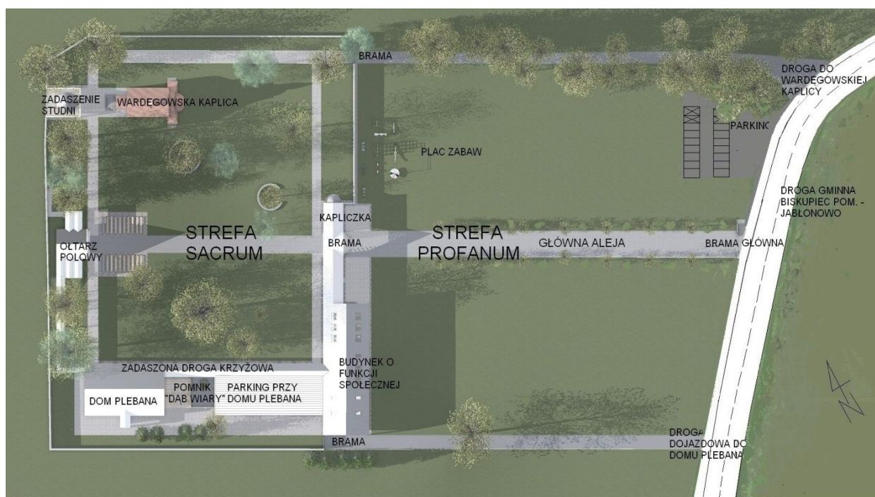
Rysunek 1. Zagospodarowanie terenu sanktuarium