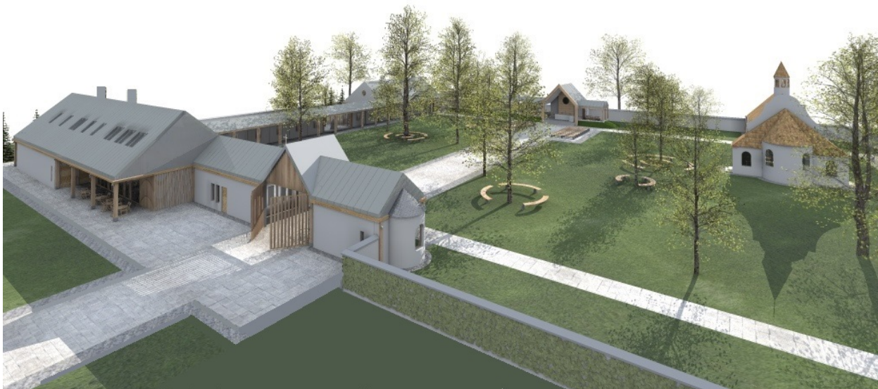
Rysunek 2. Wizualizacja strefy sacrum i profanum