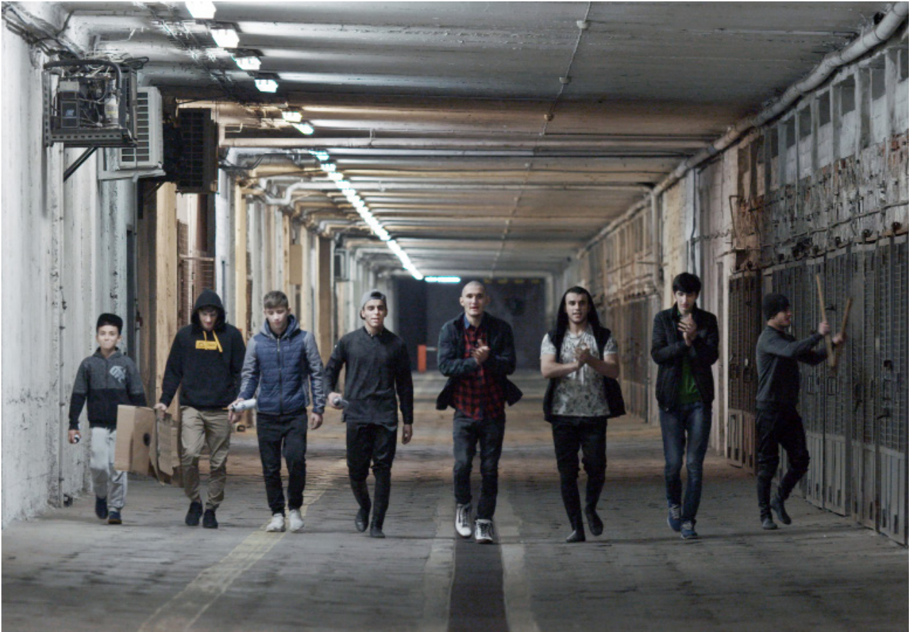
Kadr z filmu „Fight” (2019)