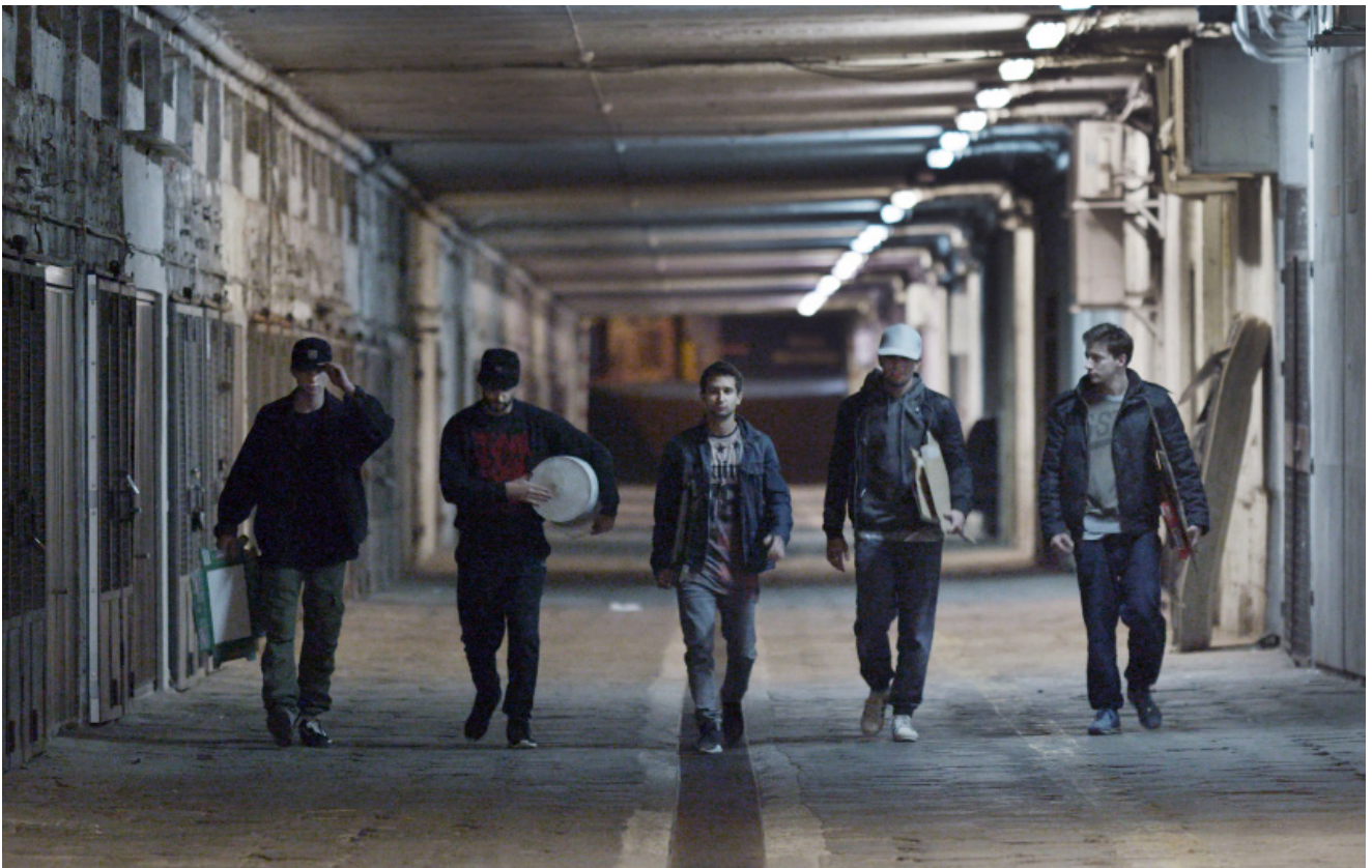
Kadr z filmu „Fight” (2019)